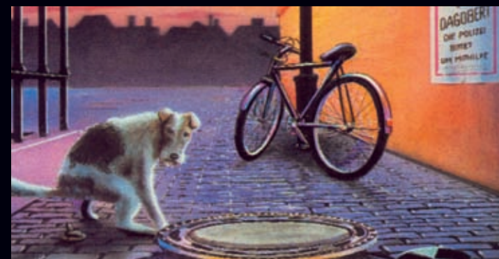
Illustration: Arno Funke

Gehen Sie mit uns auf Spurensuche in den »anderen« Berliner Untergrund und erfahren mehr über Justizfestungen und Gerichte, Strafvollzug im Dritten Reich, Schwarzmärkte in Bunkern, illegale Unternehmungen der DDR und die Unterwelt im Film.