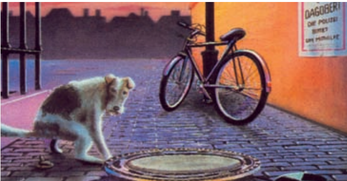
Illustration: Arno Funke

8. – 12. Oktober und 12. – 16. November 2012 4. – 5. Juni 2012 Kurzseminar